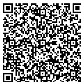
QR Code 表單

發文日期：中華民國113年12月06日 發文字號：113北市地公(12)字第0416號 速別： 密等及解密條件： 附件：